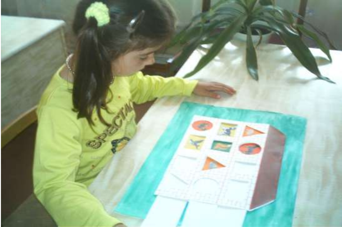
Дидактична гра «Теремок»