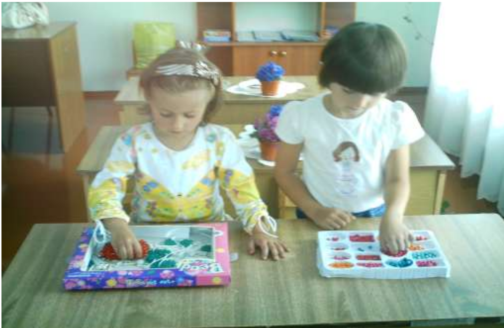
Дидактична вправа «Нанизування та сортування намиста»