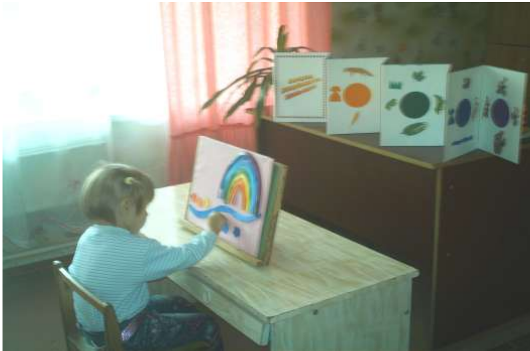
Дидактична гра «Веселка»