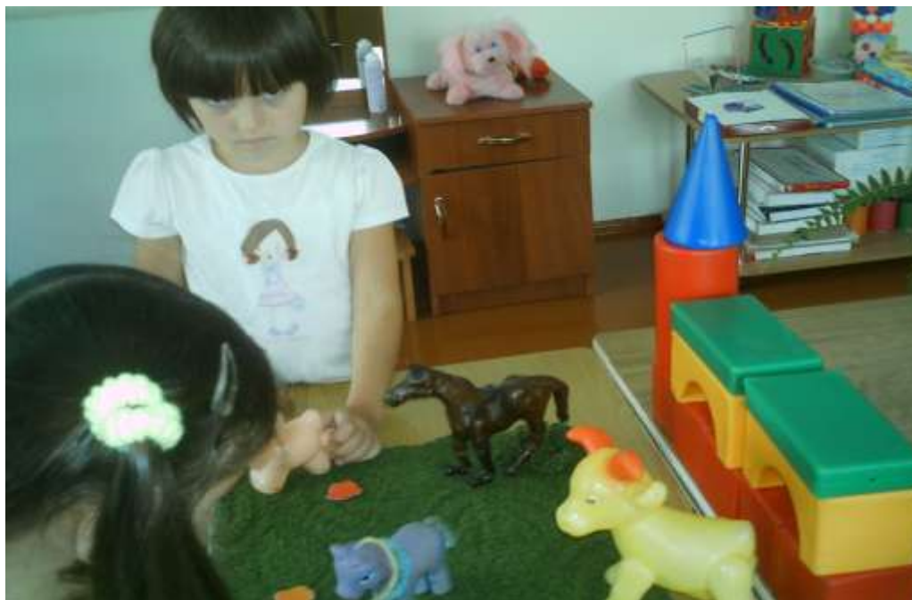
Дидактична гра «Ферма»