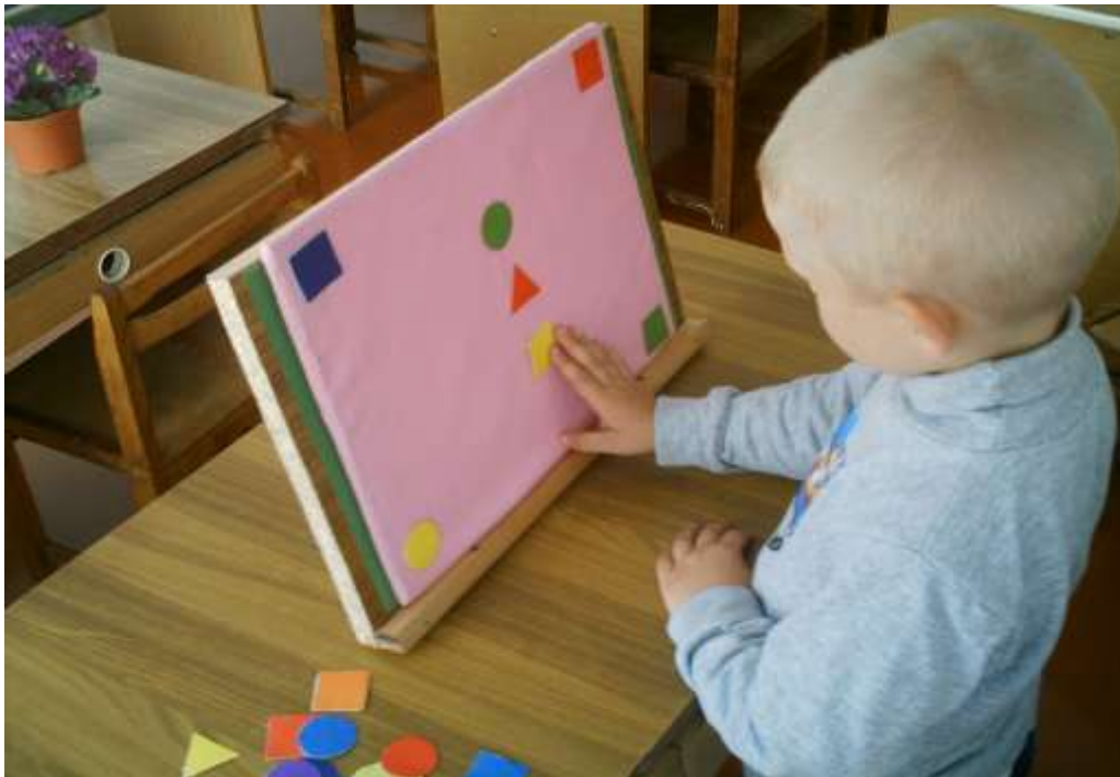
Дидактична гра «Склади візерунок»